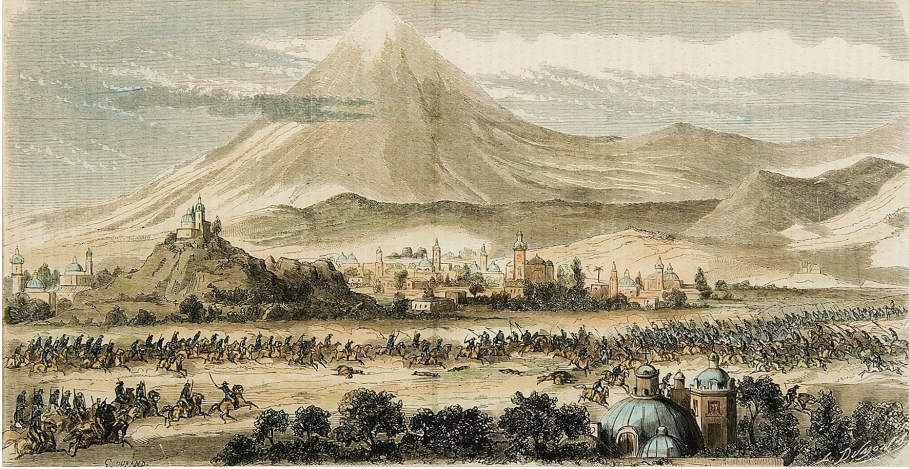
Figura 5. Combate de Cholula, 22 de marzo de 1863. Godefroy Durand y Louis Dumont (lits.), “Combat de Cholula”, L’Illustration , 23 de mayo de 1863

El 25 de marzo, el general Vicente Rosas Landa advirtió a Comonfort como “amigo” que sus destacamentos al noroeste de Puebla, dispersos, estaban expuestos a ser arrollados, así que propuso concentrar un frente robusto en Texmelucan y que sólo la caballería permaneciera en Río Prieto. 56 Tres días después, Comonfort realizó esta maniobra, porque fue interceptada una carta que rebelaba su posición, pero a la semana siguiente reinstaló a 1 000 soldados en Río Prieto, Ocotlán, Xoxtla y Santa Clara, con otros 1 000 de Mata en Huejotzingo. La caballería estaba sumamente activa por los robos que cometía: Rivera operaba de Panzacola a Amozoc y García Pueblita al sur, de Apasco a la hacienda de San José. Las brigadas de Rosas Landa y Carvajal fueron mandadas a combatir a Chacón, quien recibía apoyo vecinal, así que usaron este argumento para cometer saqueos. Comonfort coordinaba todo en la retaguardia con 3 800 soldados, la mitad del ejército del Centro, entre Texmelucan y la hacienda de San Jerónimo.