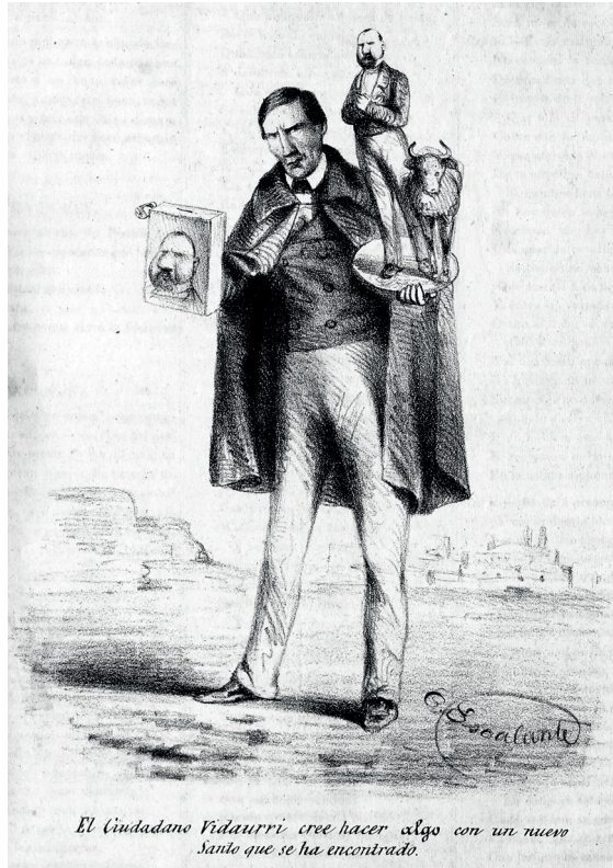
Figura 1. Caricatura de la alianza de Vidaurri y Comonfort. Constantino Escalante (lit.), “El ciudadano Vidaurri cree hacer algo con un nuevo santo que se ha encontrado”, La Orquesta , 27 de julio de 1861

Tampico y 30% de sus soldados estaban hospitalizados por fiebre amarilla. 5 Juárez contestó que “no lo obligaría a lo imposible” y le permitió partir hasta que estuviese listo, entregándole facultades plenas para reunir dinero y hombres. 6 Comonfort cubrió los gastos de la marcha con la recaudación de Tamaulipas, decomisos y préstamos; el más importante de 100 000 pesos del comerciante británico Stewart L. Jolly (figura 2). 7