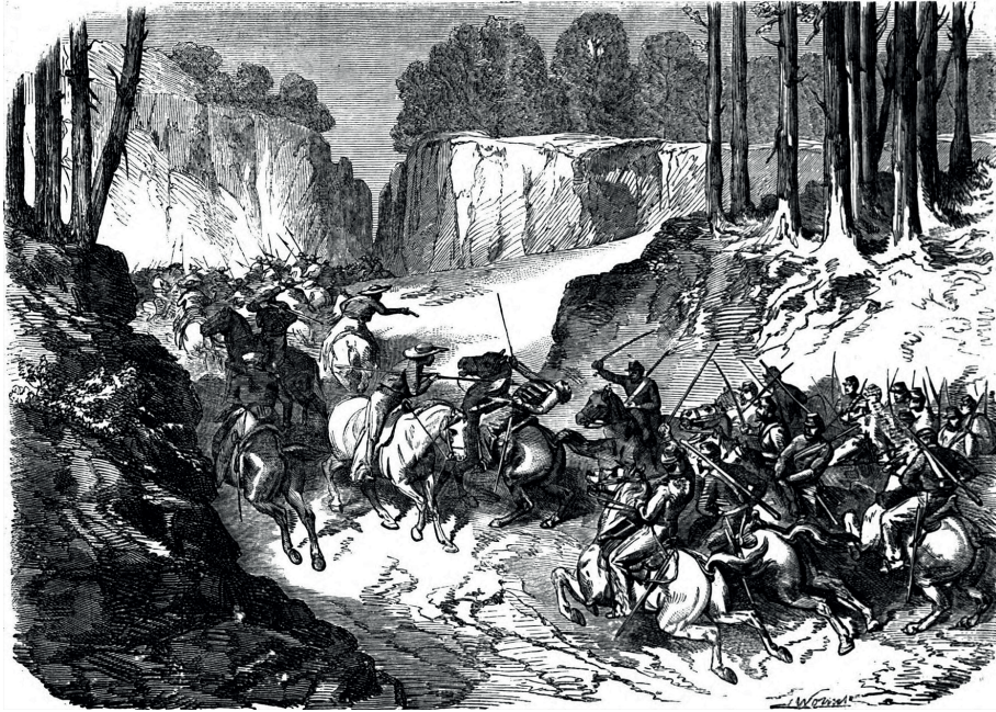
Figura 7. Episodio del combate de San Pablo del Monte, 5 de mayo de 1863. Jules Worms (lit.), “Combat de San Pablo del Monte”, L’Illustration , 11 de julio de 1863

La profecía de Rosas Landa se cumplió: el ejército del Centro fue arrollado por haberse distribuido en campamentos dispersos. Comonfort volvió a perder su prestigio y, a posteriori , se convirtió en el chivo expiatorio de la rendición de Puebla, que ocurrió el 17 de mayo. Se defendió diciendo que su derrota se debió a que Juárez lo había obligado a atacar y que González Ortega no aportó los 6 000 soldados prometidos, 72 mientras que este último lo acusó de no anunciar sus movimientos, 73 pero no mencionó que ya habían acordado una estrategia y que incumplió su parte.