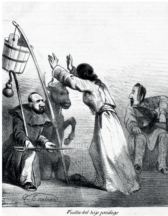
Figura 2. Caricatura del retorno de Comonfort. Constantino Escalante (lit.), “Vuelta del hijo pródigo”, La Orquesta , 12 de febrero de 1862