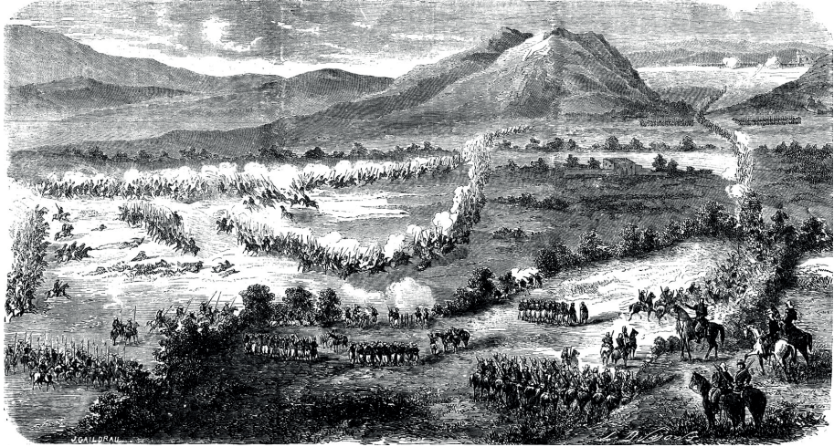
Figura 6. Combate de Atlixco, 14 de abril de 1863. Jules Gaidrau y Louis Dumont (lits.), “Ensemble topographique du combat d’Atlixco”, L’Illustration , 27 de junio de 1863